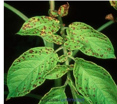
Pomme de terre

Jaunissement des feuilles avec les plus petites nervures des feuilles restant vertes pour produire un effet «damier». Le manganèse n'est pas très mobile dans la plante, les feuilles les plus récentes sont donc les plus touchées.