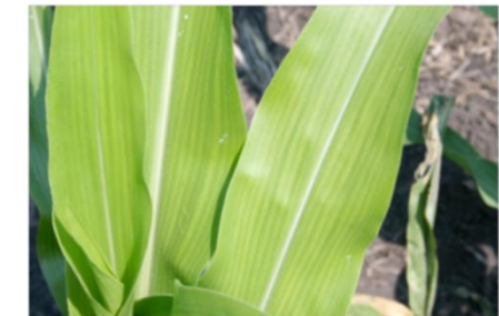
Maïs (pH élevé)