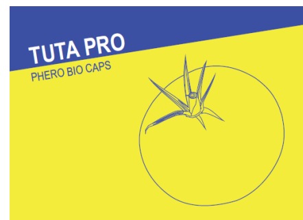
Pheromone dispenser against Tomato leafminer